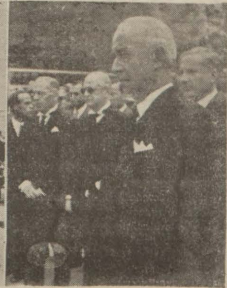
Ankarada dünkü cenaze merasiminden iki intiba: Cenaze Ulus meydanından geçerken ve Sıhhiye Vekâleti önünde yapılan merasim esnasında Milli Şef