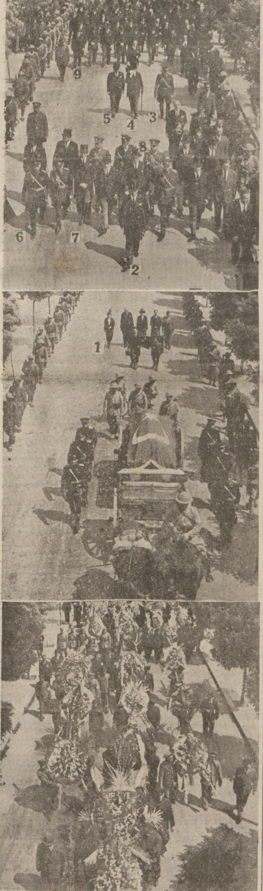
Ankarada dünkü cenaze alayı: Çelenkler, cenaze ve cenazeyi takib edenler. 1 — Merhumun ailesi, efradı, 2 — Milli Şef, 3 — Mareşal, 4 — Meclis Reisi, 5 — Başvekil, 6 — Orgeneral Salih Omurtak, 7 — İstanbul Valisi, 8 — Ankara Valisi, 9 — Vekiller ve ecebî elçileri